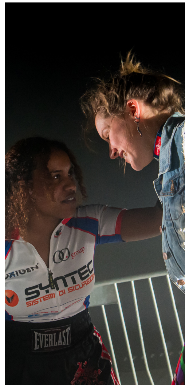
DOX Club Didi en Lodewijk

Met deze initiatieven en veranderingen blijven we streven naar innovatie en groei binnen DOX en versterken we onze positie in de culturele sector.