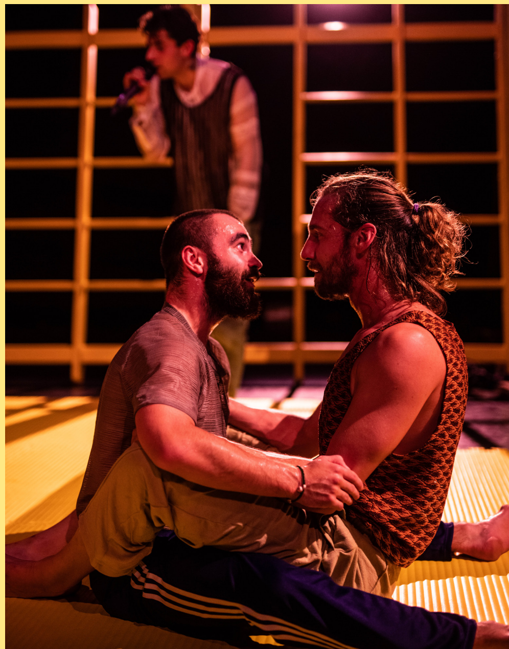
Don't Wanna Touch | Coproductie YoungGangsters

JONGE EN MEER GEVESTIGDE MAKERS KRIJGEN DE KANS OM WERK TE ONTWIKKELEN BIJ DOX MET EEN FOCUS OP VOORSTELLINGEN VOOR JONGEREN . DE MAKERS VERTEGENWOORDIGEN NIET ÉÉN STIJL, MAAR MIXEN EN MATCHEN DISCIPLINES, HEBBEN UITEENLOPENDE ACHTERGRONDEN EN ERVARINGEN EN COMBINEREN ARTISTIEKE INNOVATIE MET SOCIALE ONTWIKKELING . DE MAKERS VAN DOX STAAN MIDDEN IN DE MAATSCHAPPIJ EN NEMEN WAT HEN OPVALT IN DE WERELD OM HEN HEEN TOT ONDERWERP. WE SPELEN OP SCHOLEN, FESTIVALS, IN THEATERS, CLUBS OF ANDERE LOCATIES.