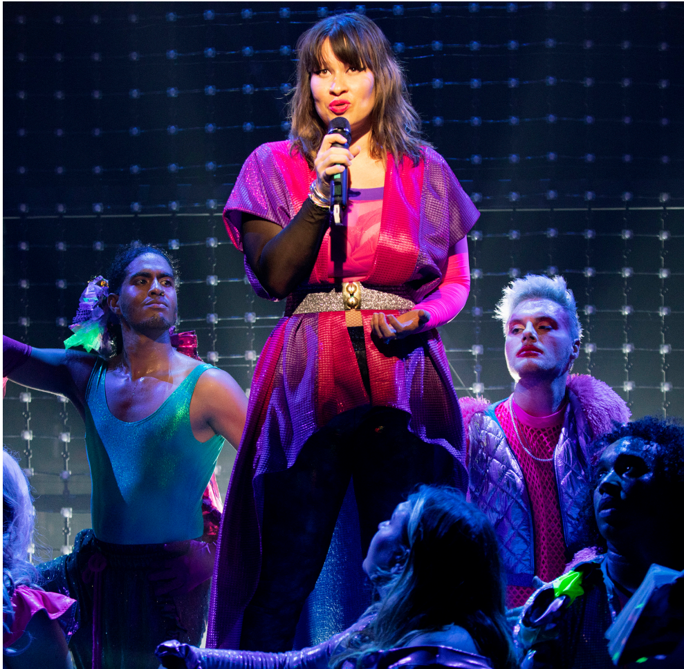
The Hot Peaches | Coproductie De Toneelmakerij

Wervelende, multidisciplinaire voorstelling over de zoektocht naar jezelf