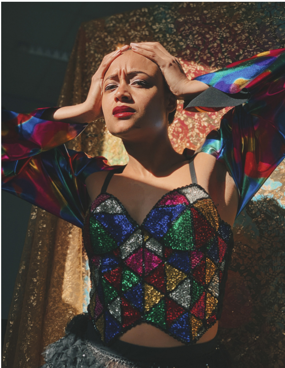
Repetitiefoto Creative Club Cherise & Saksia