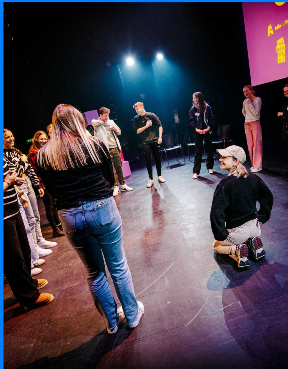
Educatie workshop Bewegingstheater

DOX HEEFT IN 2023 IN TOTAAL 3814 JONGEREN VANAF 12+ BEREIKT MET SCHOOLVOORSTELLINGEN, NAGESPREKKEN, WORKSHOPS, RANDPROGRAMMERING EN EVENEMENTEN.