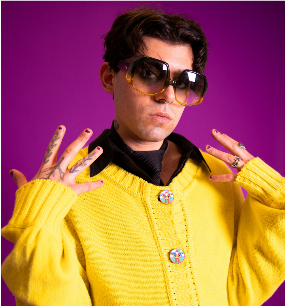
Tano Rivers maker en performer bij DOX | © Megan Jane Simons