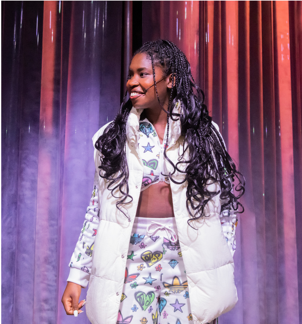
Sjenk | Coproductie Theater Utrecht