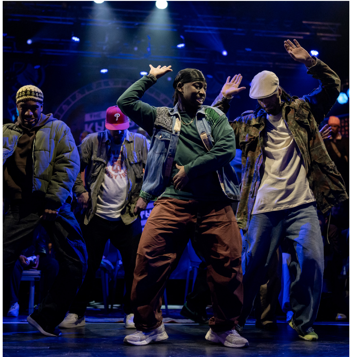
The Kulture of Hype&Hope

Elk van deze verhalen vertegenwoordigt een prachtige ontmoeting en draagt bij aan de rijke geschiedenis van ons evenement. We horen steeds vaker dat The Kulture of Hype&Hope als een soort thuisbasis voelt voor velen, en dat is een gevoel van trots dat ons blijft motiveren.'