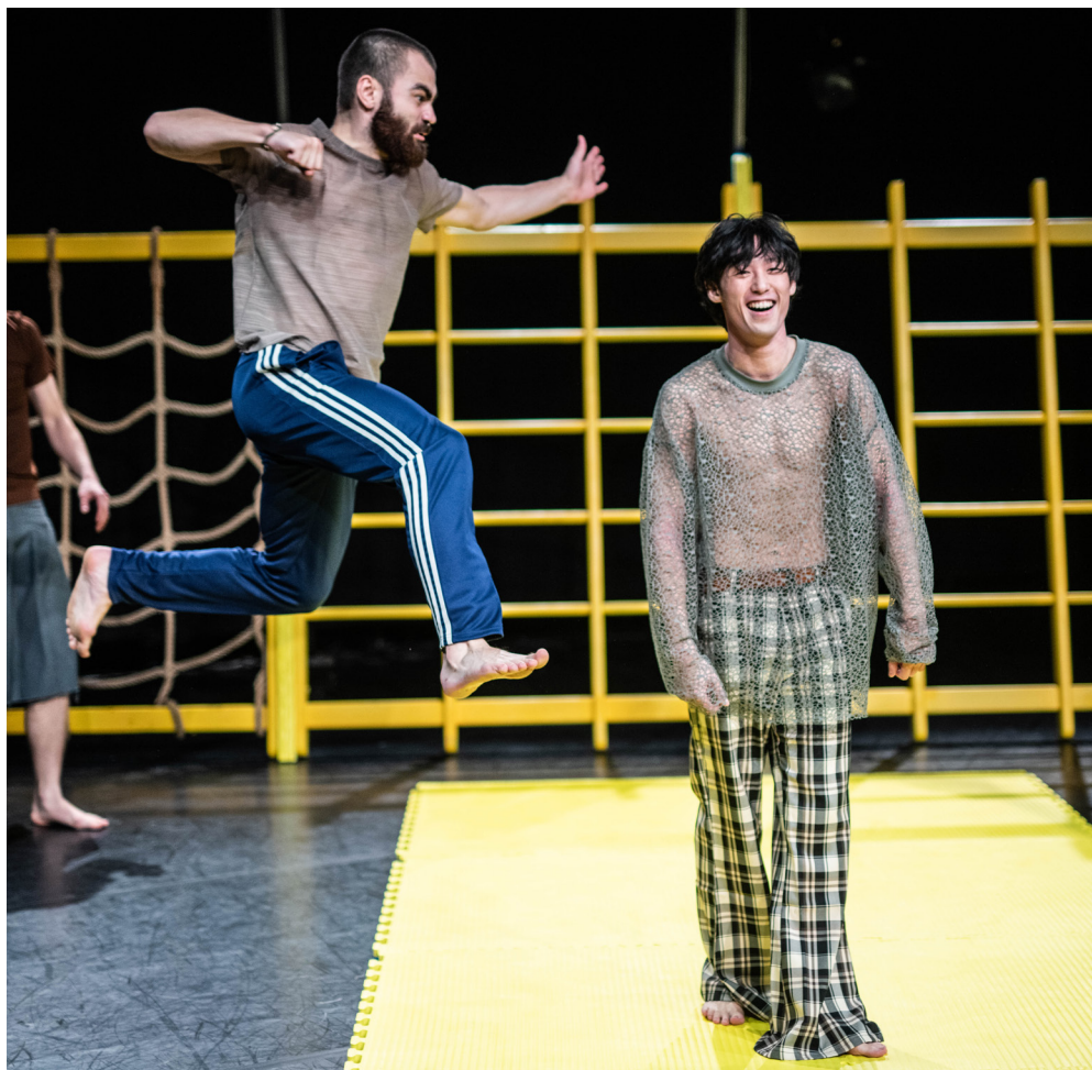
Don't Wanna Touch | Coproductie YoungGangsters | © Bart Grietens