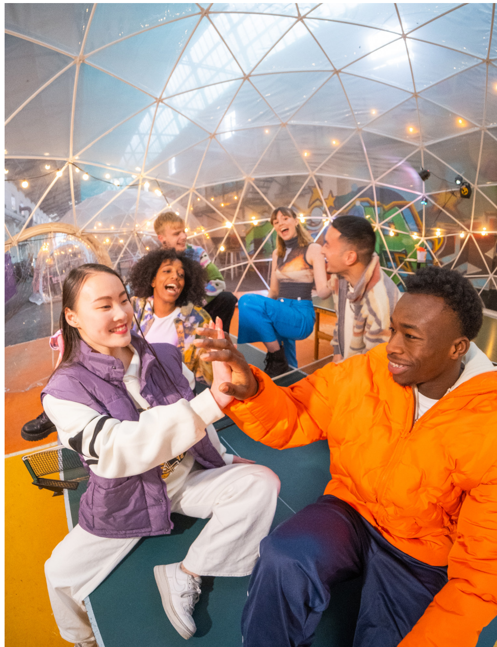
Landelijke auditiecampagne DOX Club '23