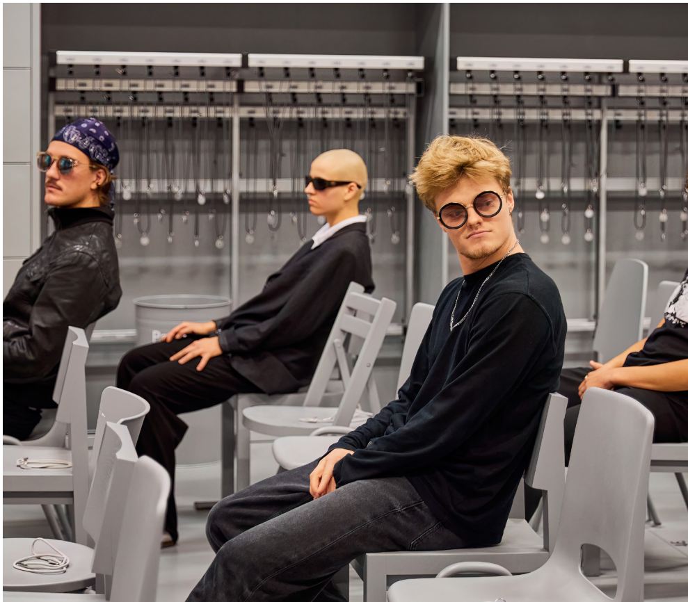
DOX Club in Stoel neemt stelling | Coproductie Centraal Museum

Tijdens Stoel neemt stelling nodigt het Centraal Museum samen met DOX bezoekers uit om stil te staan bij de vele vormen en betekenissen van de stoel. Met de stoel als verbinder en maatschappelijke metafoor kun je je afvragen: wie krijgt er een plek aan tafel? Deze vraag staat centraal tijdens Centraal Laat op 26 oktober, geïnitieerd door DOX. DOX programmeerde een dynamische avond gevuld met dans, theater, workshops, performances en een rave party. Verwacht zitten, staan, bewegen, beschouwen en bewonderen tijdens deze interactieve en speelse avond.