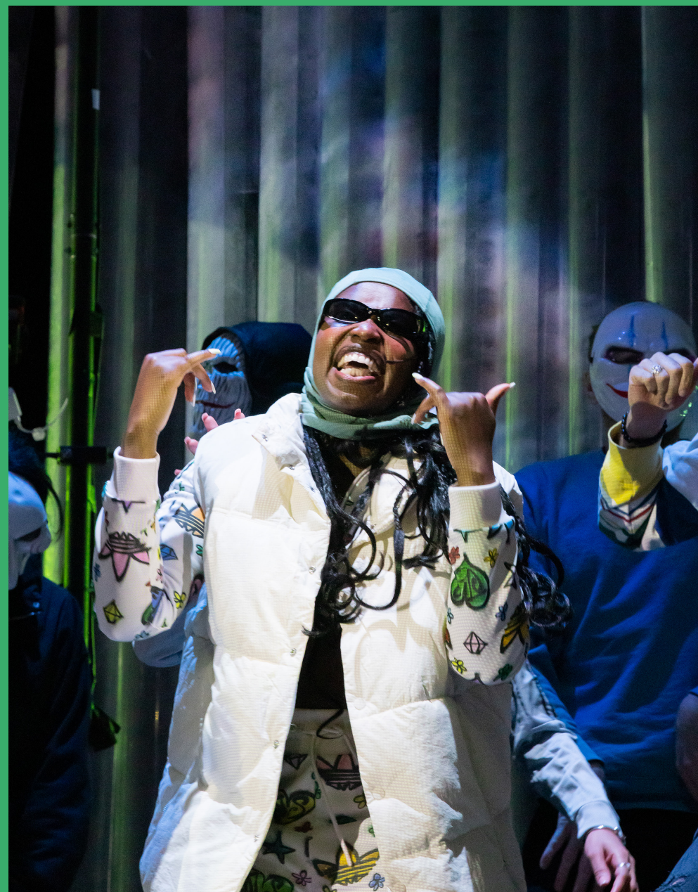
Sjenk | Coproductie Theater Utrecht

HET MOTTO VAN DE MARKETINGAFDELING LUIDT: 'TRIAL AND ERROR: DE WEG NAAR SUCCES BEGINT MET DURVEN PROBEREN. ' DOOR TE EXPERIMENTEREN EN TE TESTEN, STIMULEREN WE INNOVATIE EN CREATIVITEIT.