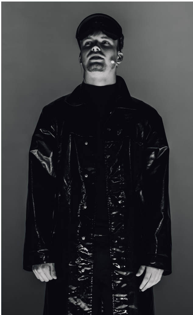
DOX Club Mohamed & Katy