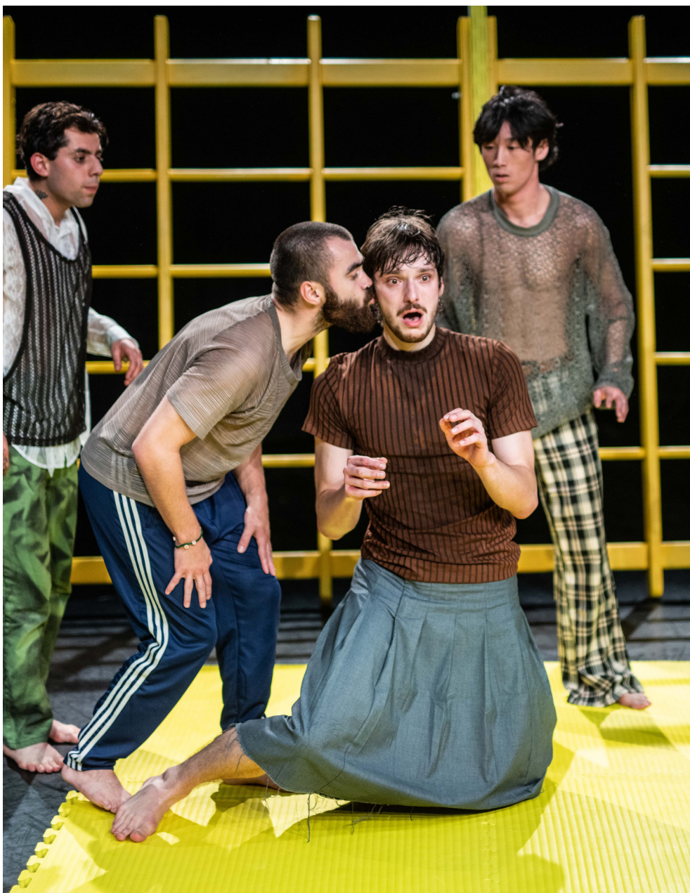
Don't Wanna Touch | Coproductie YoungGangsters | © Bart Grietens