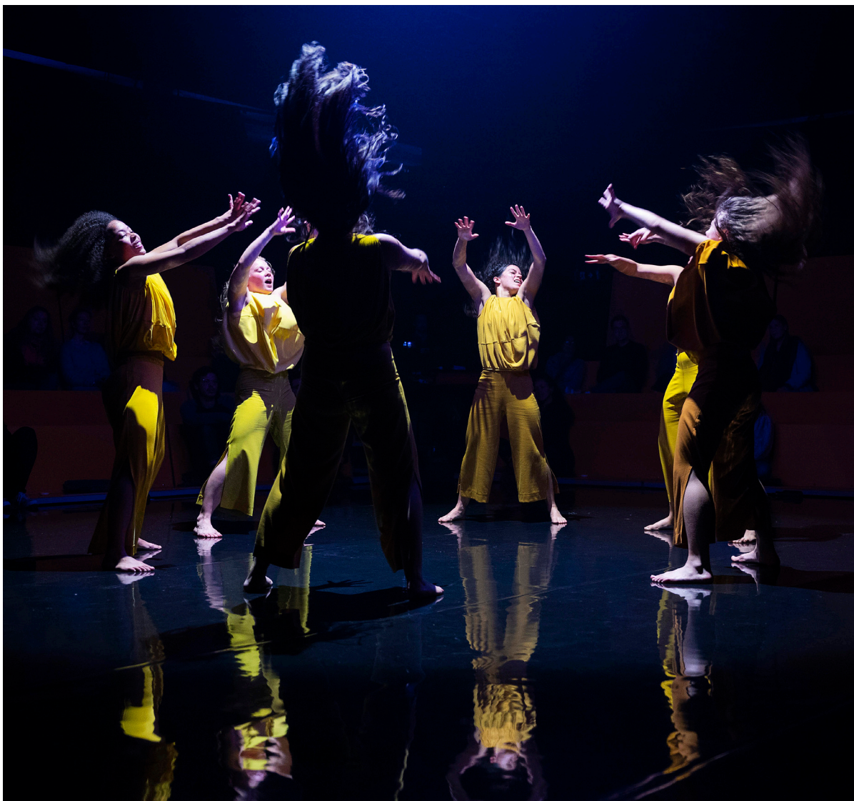
Eros | Coproductie Schweigman&

DOX is een lokaal- en (inter)nationaal-georiënteerde ontwikkelinstelling die voorstellingen produceert en een broedplaats en gezelschap is. Onze core business is het produceren van vernieuwende podiumkunst voor jongeren met roots in de urban arts en talentontwikkeling.