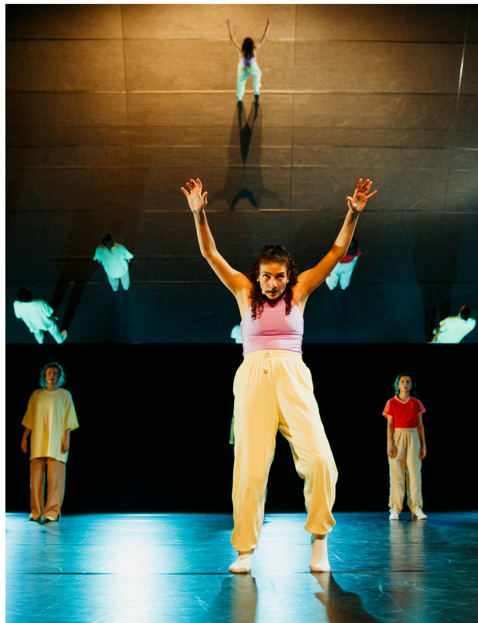
Quake | Coproductie Theater Utrecht