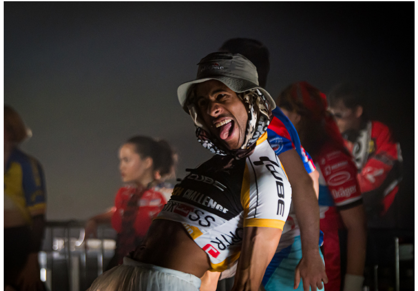
DOX Club Didi & Lodewijk