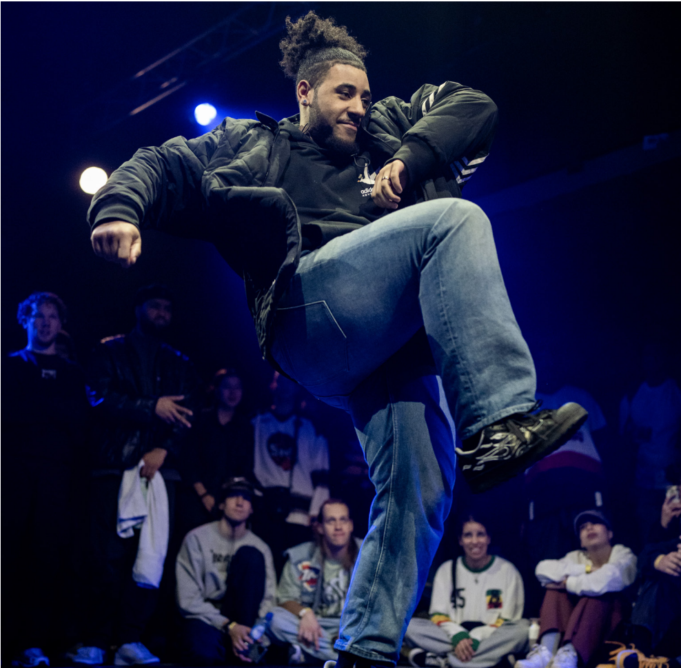
The Kulture of Hype&Hope

4 elements, 4 events, 1 final battle and only 1 winner!