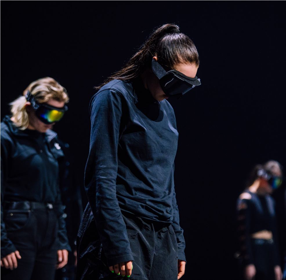
DOX Club Mohamed & Katy