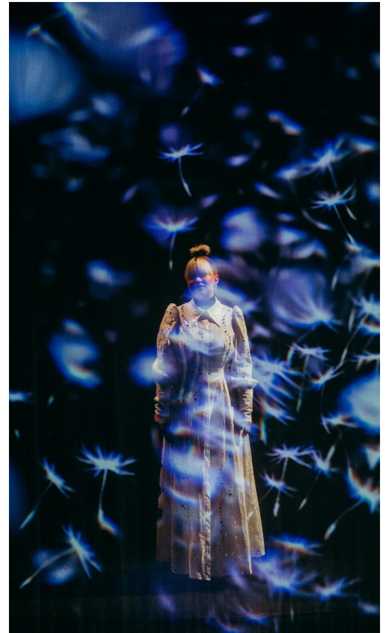
Anne-Fay's Reaspora