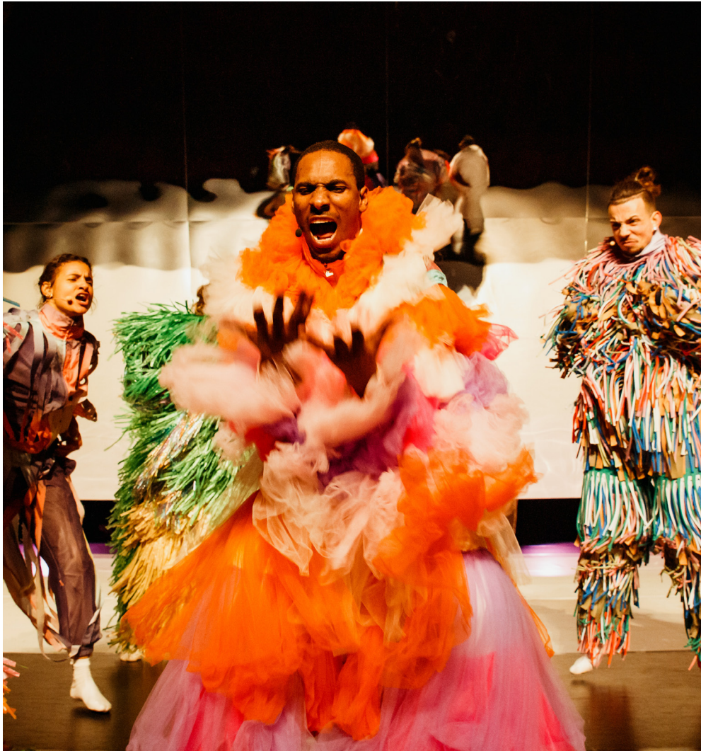
Quake | Coproductie Theater Utrecht