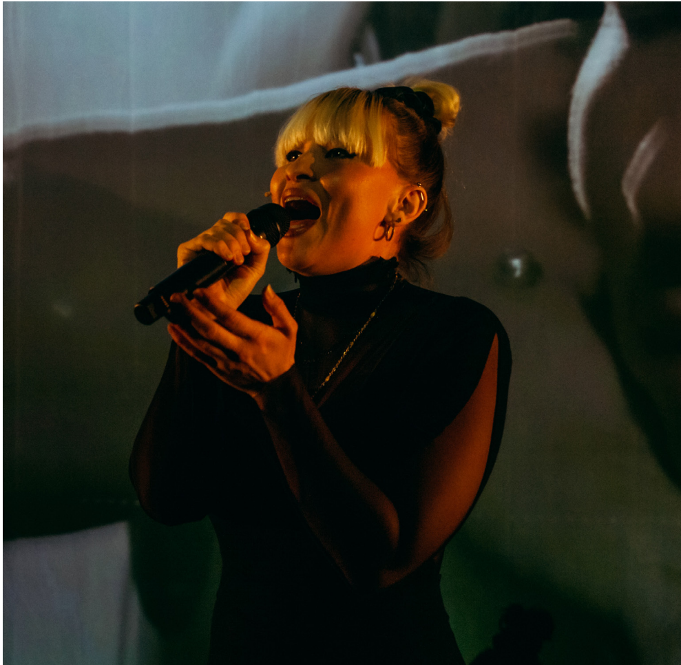
Anne-Fay's Reaspora

Met een witte huid, dwars door haar zwarte familiegeschiedenis