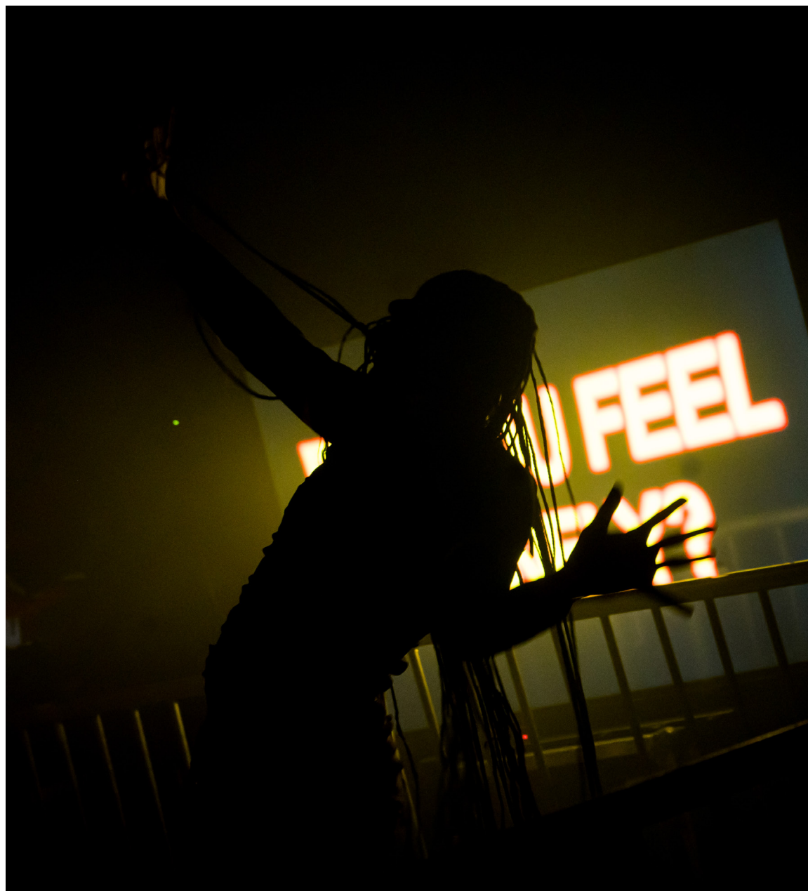
DOX Club Didi en Lodewijk

Het versturen van nieuwsbrieven stelt DOX in staat om rechtstreeks te communiceren met haar 'DOX Fans'. Waar we eerder de nieuwsbrieven met name gebruikten voor belangrijke boodschappen en updates rondom producties, gooiden we het vanaf seizoen '23/'24 over een andere boeg. We merkten dat de nieuwsbrief minder en minder werd geopend (een percentage rond de 35%). In het nieuwe seizoen zijn we begonnen met het versturen van andere types mailing: thematische nieuwsbrieven, van het seizoen uitlichten tot aan DOX Club en educatiemailings met een frequentie van gemiddeld één nieuwsbrief per drie maanden. Met als doel: nieuwsgierigheid opwekken en aandacht behouden. Resultaten hiervan zullen pas in 2024 zichtbaar zijn.