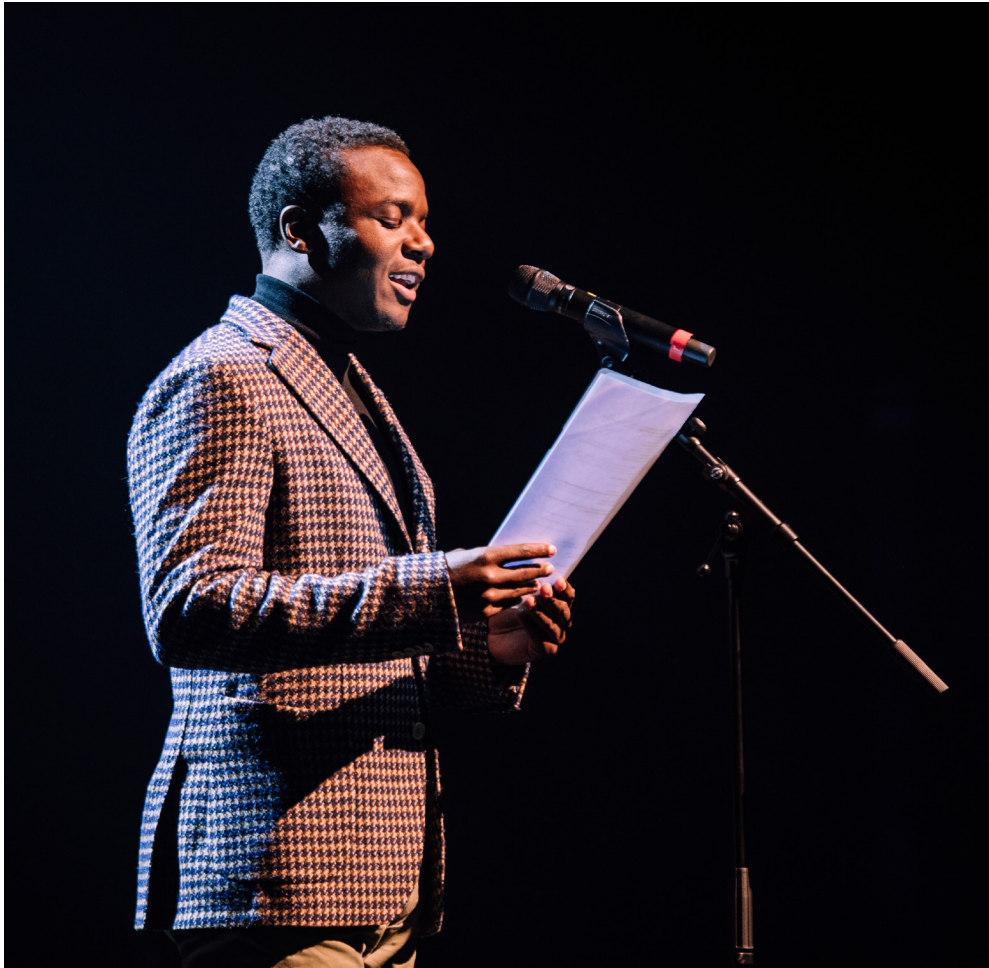
Theater Na de Dam | Coproductie: Theater Utrecht