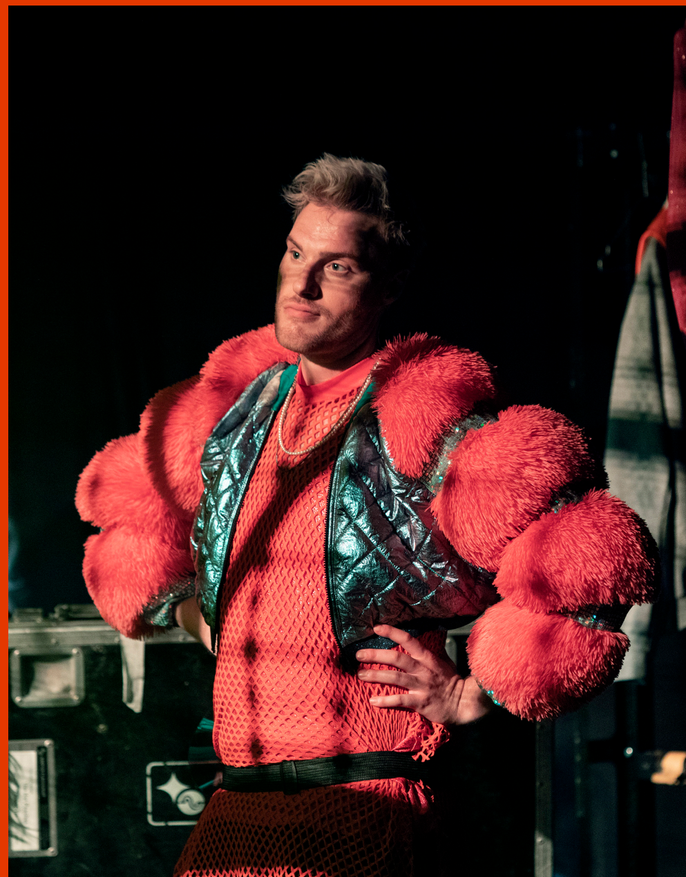
The Hot Peaches | Coproductie DOX en De Toneelmakerij | © Sanne Peper

DOX WAS OOK IN 2023 WEER HÉT HUIS VOOR MAKERS EN JONGE PERFORMERS . ONZE ACTIVITEITEN HEBBEN WE KUNNEN REALISEREN DOOR EEN BEVLOGEN TEAM VAN 15 MEDEWERKERS. WE ZIJN SUPERTROTS OP WAT WE ALS TEAM HEBBEN WETEN TE BEREIKEN, ONDANKS HET DYNAMISCHE JAAR, WAARIN PERSONEELSWISSELINGEN, ZIEKTE EN OPENSTAANDE FUNCTIES ZORGDEN VOOR VOLDOENDE UITDAGINGEN. DAARNAAST ZIJN DE EERSTE STAPPEN GEZET RICHTING HET VERDUURZAMEN VAN ONZE ORGANISATIE , PERSONEELSBESTAND , PROCESSEN EN WERKWIJZEN .