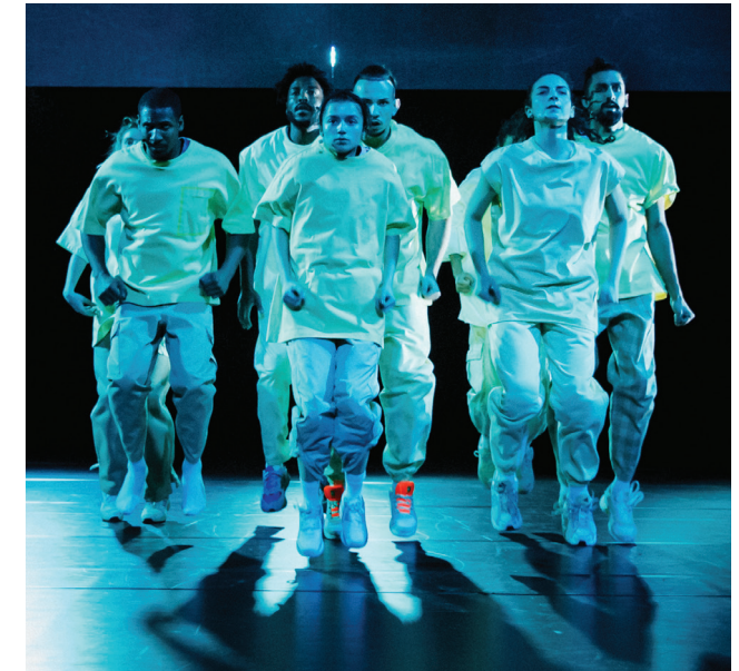
Quake '22/'23 – coproductie Theater Utrecht

Voor de nieuwe beleidsperiode stellen we nog scherpere eisen: de uitgangspunten vormen de ondergrens in plaats van iets waarnaar gestreefd wordt. Op dit moment vindt er een grootschalige inventarisatie plaats voor alle kostuums, decors en rekwisieten in onze opslag. Deze worden uitgebreid gedocumenteerd. Dit overzicht wordt meegenomen in de ontwikkelfase van nieuwe producties en hernemingen om hergebruik van materialen te stimuleren en te vereenvoudigen. Dit overzicht zal worden gedeeld met onze partners zodat ook zij van deze materialen gebruik kunnen maken.