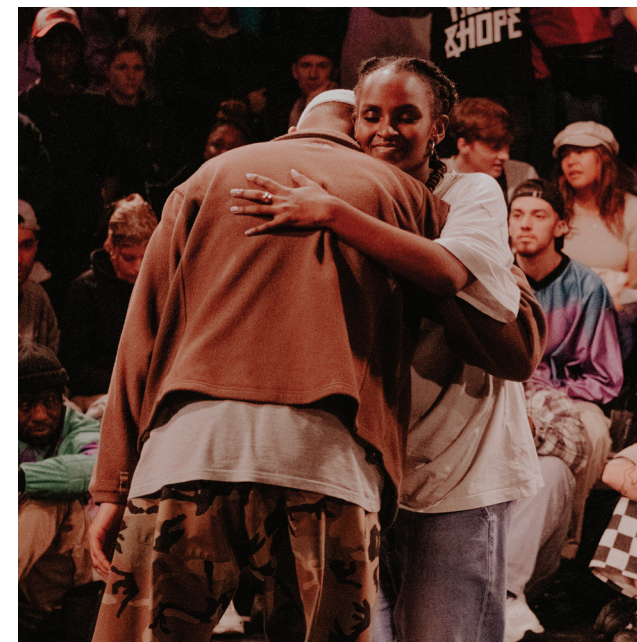
The Kulture of Hype&Hope in de Helling Utrecht '22

hiphopsceen; inmiddels zijn er per editie meer dan 400 deelnemers en doen er crews uit meer dan dertig landen mee aan de competitie. Er worden ook zogenaamde dojo's georganiseerd. Dit zijn workshops die in het teken staan van kennisuitwisseling en het onderwijzen van de principes van hiphop, zodat alle participanten kunnen leren van wat de hiphopcultuur hen te bieden heeft. De vergelijkbare doelstellingen van DOX en The Kulture of Hype&Hope op het gebied van transculturaliteit en de uitgangspunten van de hiphopcultuur maken het festival tot een ideale samenwerkingspartner.