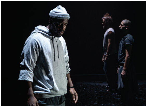
Birds '21/'22

DOX Educatie wil speciaal aandacht besteden aan jonge nieuwkomers door een samenwerking aan te gaan met Utrechtse AZC's, stichting de Vrolijkheid en Vluchtelingenwerk Utrecht. DOX investeert in talentontwikkeling en zichtbaarheid van deze groep en zal met hen onder begeleiding een voorstelling maken. Een andere samenwerkingspartner hierin is New Dutch Connections, waarmee DOX een buddyproject lanceert tussen jonge vluchtelingen & DOX'ers uit de DOX Club.